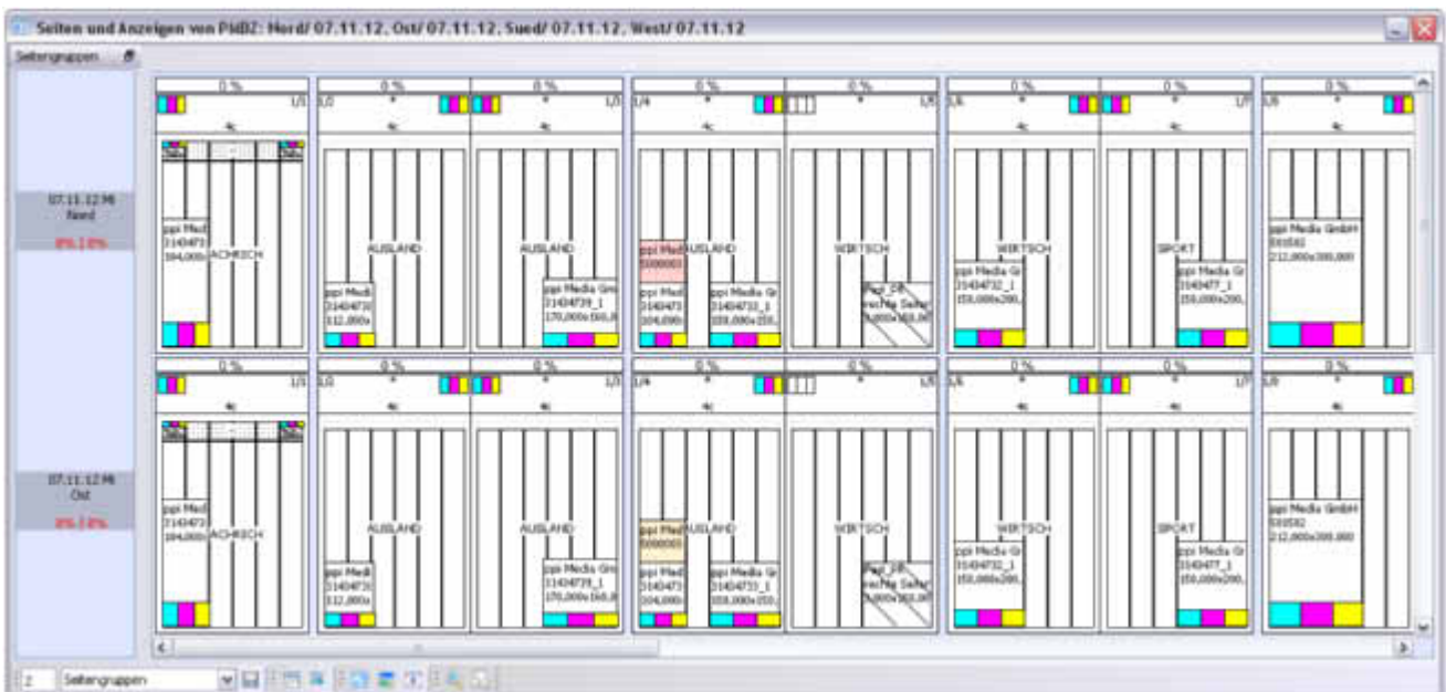
Der AdDispo-Seitenspiegel bietet eine übersichtliche Darstellung aller reservierten und festgebuchten Anzeigen.

Für Verlage, die ihr Angebot in Richtung Multi-Channel-Publishing erweitern wollen, bietet ppi eine passgenaue Lösung. Das Web-basierte Modul AdX dient zur kombinierten Disposition von Werbeformaten für die unterschiedlichen Ausgabe-Kanäle Online, Mobile und Print. AdX lässt sich höchst flexibel einsetzen, ganz nach den aktuellen Schwerpunkten der jeweiligen Sales-Strategie. Deshalb ist es gleichermaßen für den Einstieg ins Online-Advertising wie auch für die übergreifende Disposition von Premium Packages im Rahmen multimedialer Kampagnen geeignet. (Weitere Informationen s. Data Sheet AdX.)