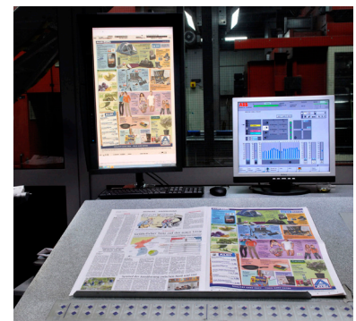
Der Leitstand bei Aschendorff Druckzentrum GmbH & Co. KG